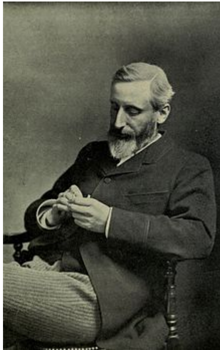
Charles Grant Blairfindie Allen (Kingston, 24 febbraio 1848 – Hindhead, 25 ottobre 1899)

E' stato uno scrittore e naturalista canadese.